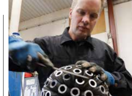
HANTVERK. Allt får en grundlig slutputs så att inga svetsloppor eller vassa kanter blir kvar på den färdiga produkten.